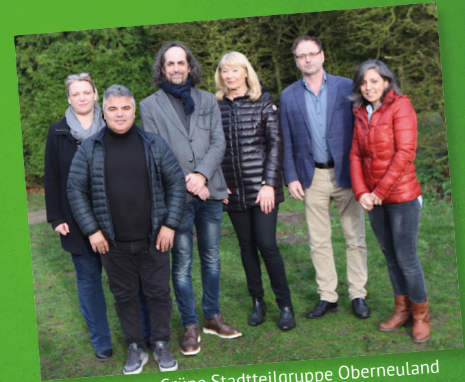
Grüne Stadtteilgruppe Oberneuland

Es fehlt in Oberneuland an attraktiven und naturnahen Freizeitangeboten - insbesondere für die junge Generation ansprechende Spielorte und Treffpunkte. Der auf Wachstum bedachte Stadtteil muss sich auch hier entwickeln und Initiativen, Vereinen, jungen Musikern und Künstlern Räume anbieten können. Ein Bürger- und Kulturzentrum in zentraler Lage (z. B. eine Erweiterung des alten Ortsamtes) könnte diese Lücke schließen! Der Achterdieksee sollte weiterhin vielseitig für Erholung und Sport nutzbar sein. Eine Entwicklung der Randbereiche, z.B. durch eine zeitgemäße Erneuerung der Spielgeräte und Bau eines Skateparks unterstützen wir.